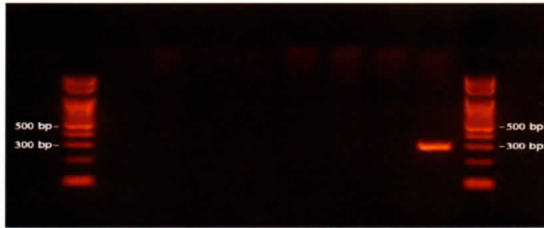
電気泳動像 (Gel electrophoresis of PCR products)

(・ KHV specific amplicon was not detected by PCR test using genomic DNA extracted from gills of samples as template.)