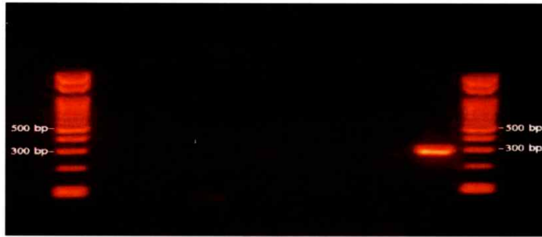
電気泳動像 (Gel electrophoresis of PCR products)

(・ KHV specific amplicon was not detected by PCR test using genomic DNA extracted from gills of samples as template.)